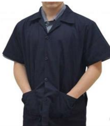
Gabacha para mecánico manga corta, cuatro bolsas