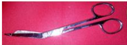
Tijera punta redonda

Juegos de férulas para extremidades, superiores dos piezas ( 11.5" X 2 1/4" X 1/4" muñeca a brazo, 15.5" X 2 1/4" X 1/4" brazo ) en su estuche para traslado