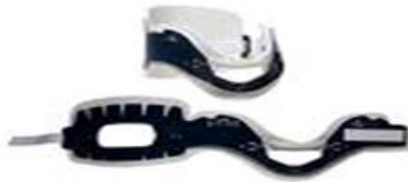
Cuello cervical semi rígido regulable con agujero

Arnés para camilla tipo araña, en faja de 2" en varios colores, cierre de velcro de 10, 12 puntos de amarre con reflectivo y sin reflectivo