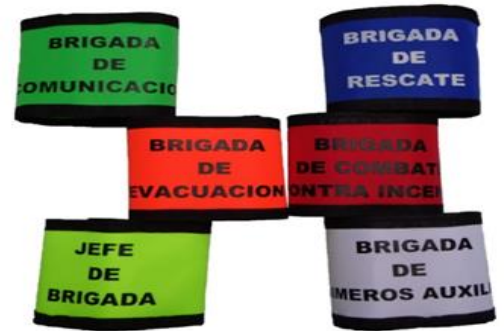
Brazaletes para brigadista en colores

Overoles chaquetas largas y corta para cuartos fríos