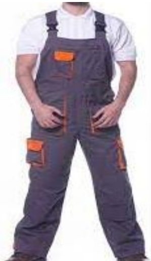
Overoles con peto ò pantalón con pecho y tirantes para, mecánico