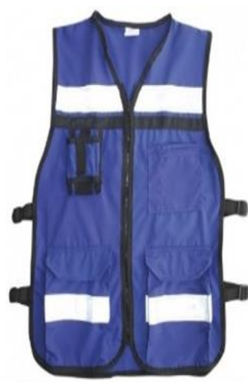
Chalecos tipo brigadista, con cinta reflectiva, de 1" y 2", 4 bolsas de parche ampliadas con chapeta, cierre de velcro, más una escondida de cierre de zipper

Calle Constitución Condominios Satélite edificio E - 1; Ciudad Satélite San Salvador, El Salvador; Centro América