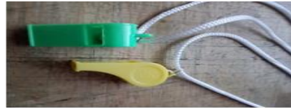
Silbato plástico con cuerda