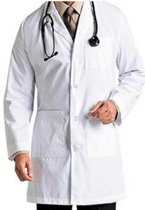
Gabacha médica, lavatorios cárnico manga larga o corta

Calle Constitución Condominios Satélite edificio E - 1; Ciudad Satélite San Salvador, El Salvador; Centro América